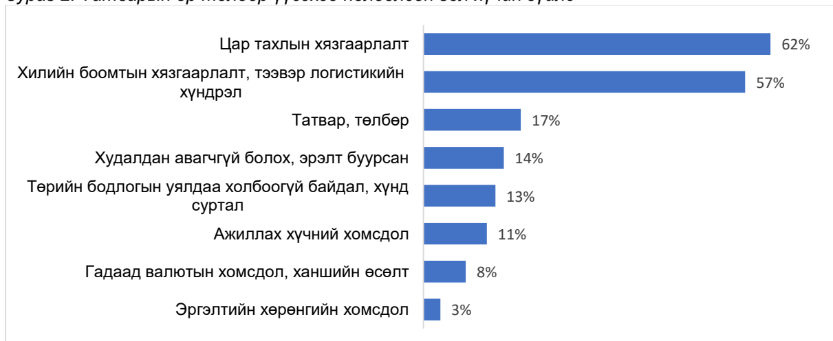
Зураг 2. Татварын өр төлбөр үүсэхэд нөлөөлсөн гол хүчин зүйлс

Асуулгад оролцсон аж ахуйн нэгжүүдээс татварын өр, төлбөр үүсэхэд нөлөөлсөн гол хүчин зүйлийн талаар тодруулахад 62% нь цар тахлын дараалсан хөл хорио хязгаарлалтууд, 57% нь хил боомтын удаашрал хүндрэлтэй холбогдуулан тээврийн нөхцөл муудан түүхий эд, бараа материалын үнийн өсөлт хамгийн их нөлөөтэй байсан байна. Мөн 18% нь татвар, төлбөртэй холбогдох зардал (НДШ, НӨАТ, газрын төлбөр, түрээсийн төлбөр г.м), 14% нь худалдан авагчийн эрэлт буурсан, 13% нь төрийн бодлогын уялдаа холбоогүй ойлгомжгүй байдал хүнд суртал, 11% нь ажиллах хүчний хомсдол, 8% нь гадаад валютын ханшийн хомсдол, өсөлт голлох нөлөөтэй байна гэжээ. (Зураг 2).