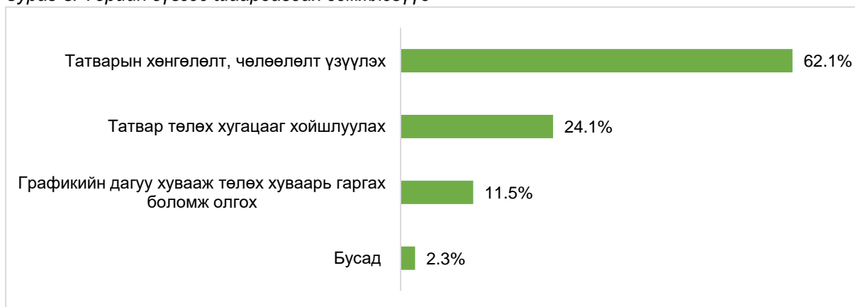
Зураг 3. Төрийн зүгээс шаардагдах дэмжлэгүүд

Бусад шаардагдах дэмжлэгийг нээлттэй асуулгаар тодруулахад дараах гол саналуудыг ирүүлсэн. Үүнд: